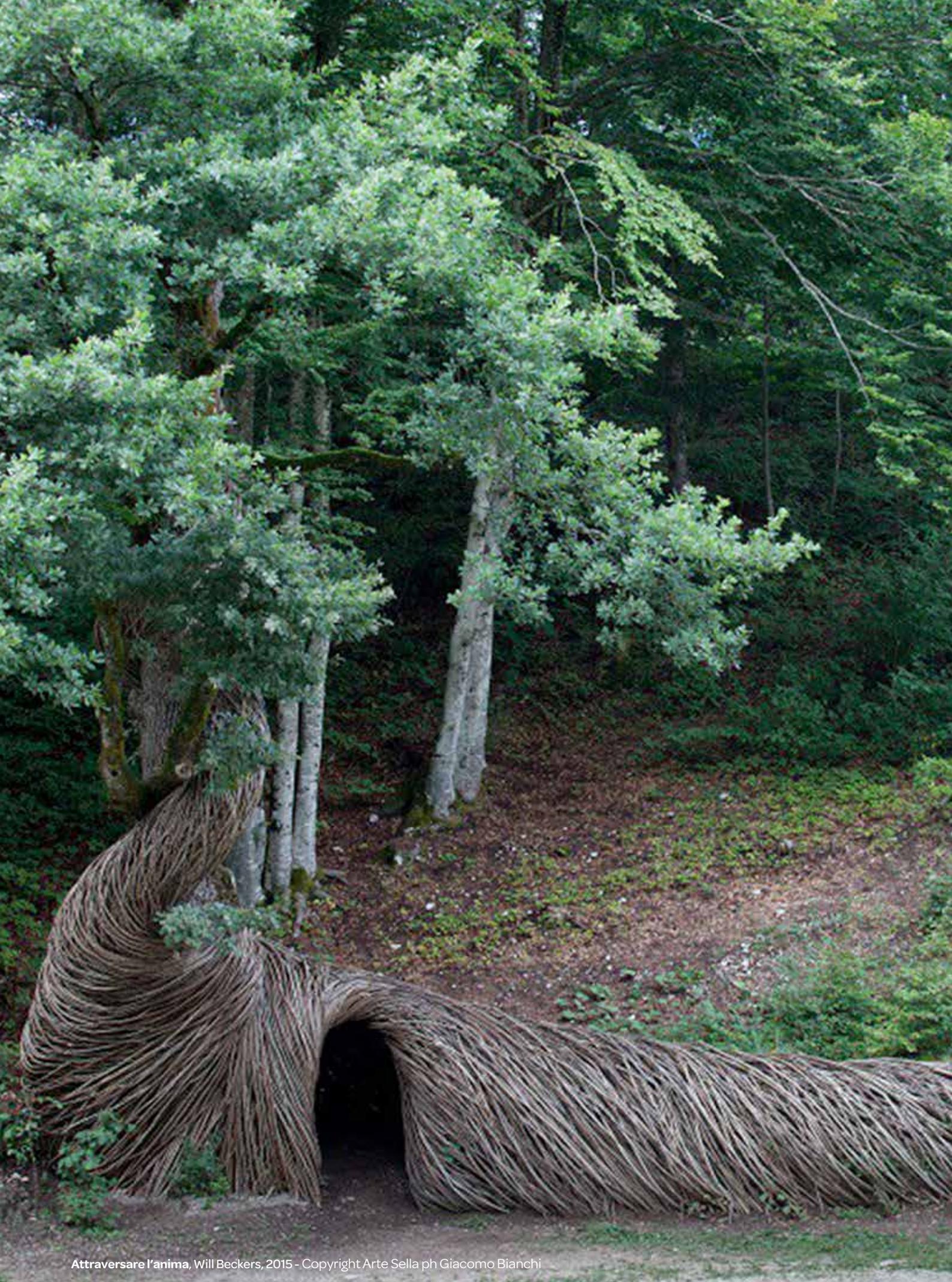
Attraversare l'anima, Will Beckers, 2015